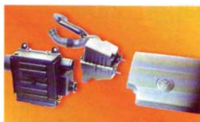
Rechts: Die Sogefi Filter Division fertigt Luftfilterkomponenten und Luftfilterabsaugsysteme komplett aus Kunststoff.