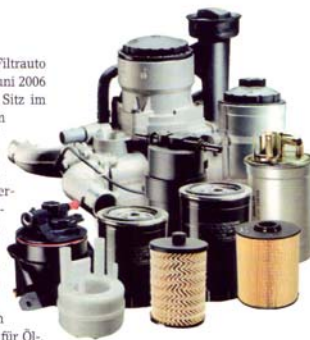
Mit dem Zusammenschluss will Sogefi Filtration Deutschland im internationalen Ersatzteilgeschäft kräftig wachsen.

Eigenen Angaben zufolge decken die Filterhersteller mit den Marken für Öl-, Luft-, Kraftstoff- und Innenraumfiltern 'Purflux', 'Fram' und 'Tecnocar' rund 98 Prozent des deutschen Marktes ab.